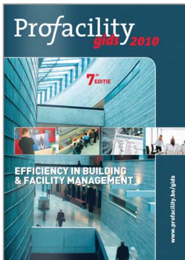
De gids doorbladeren: www.profacity.be/guide2010