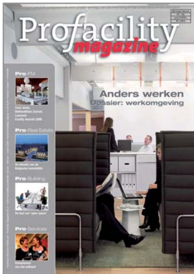
Een magazine doorbladeren: www.profacility.be/mag