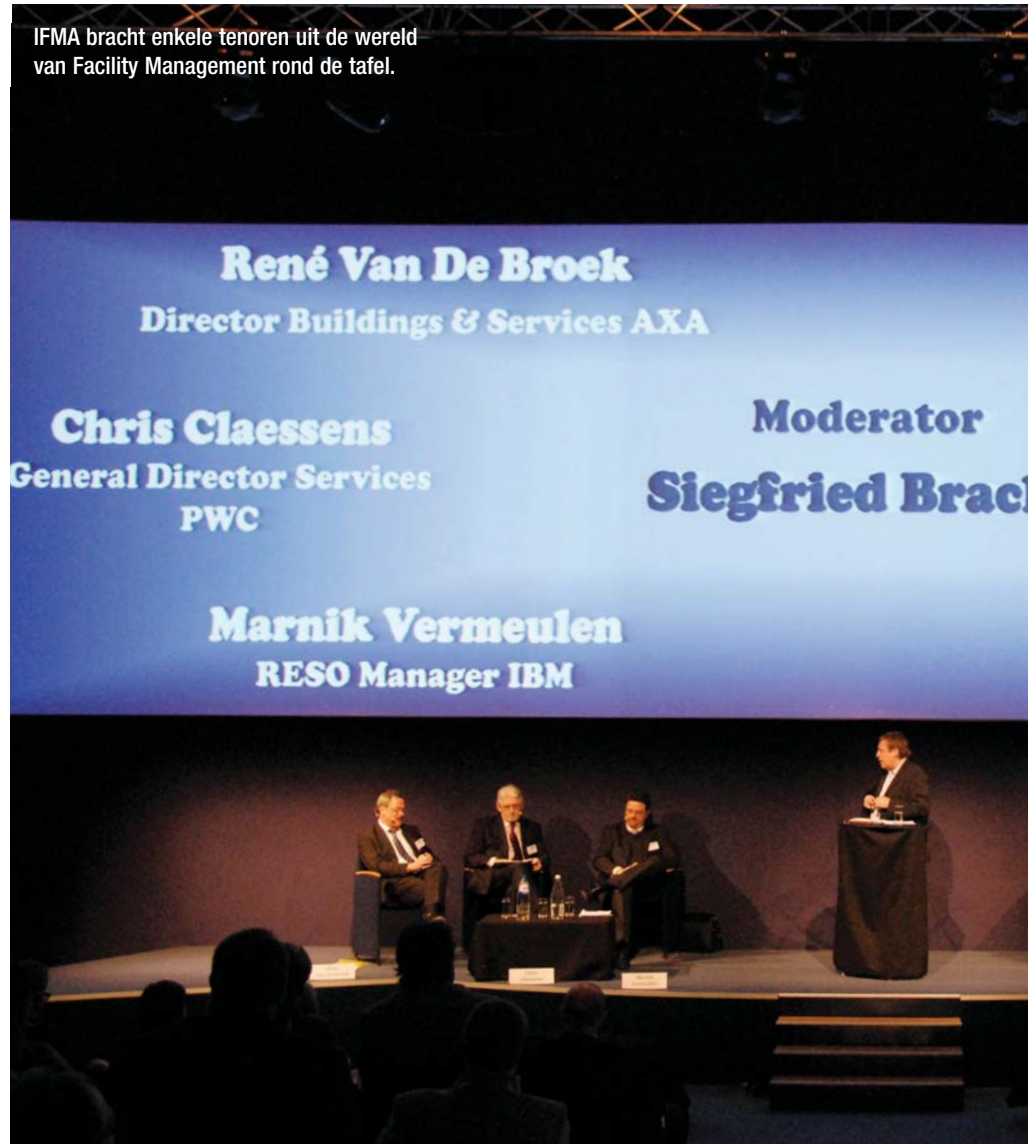
IFMA bracht enkele tenoren uit de wereld van Facility Management rond de tafel.

IFMA bracht enkele tenoren uit de wereld van Facility Management rond de tafel voor een open debat rond de evolutie van deze discipline in de actualiteit van een harde economische crisis. Wordt de rol van FM beknot door de huidige toestand of is dit juist een opportuniteit om de al lang voorbereide FM-projecten te concretiseren?