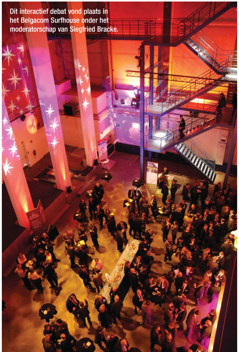
Dit interactief debat vond plaats in het Belgacom Surfhouse onder het moderatorschap van Siegfried Bracke.

wel een grote foto van het gebouw in staan! FM draagt in grote mate bij tot de identiteit en de representatie van een bedrijf.