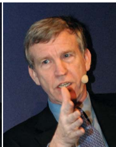
Roland Duchâtelet (Senator)

Roland Duchâtelet (Senator): Wanneer taken kritisch zijn voor het eigenlijke bedrijfsproces (vb. ziekenhuis) is het aangeraden ze zelf te doen. In andere gevallen is outsourcen aangewezen. Vroeger was iedereen overtuigd dat IT een interne aangelegenheid was; vandaag is outsourcen de regel.