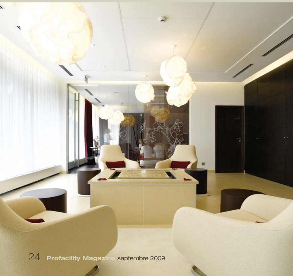
Les salles de réunion des 'breakout rooms' sont décorées de façon sereine. Lumière et couleurs sont stimulantes.