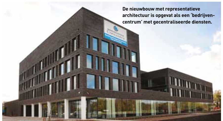
De nieuwbouw met representatieve architectuur is opgevat als een 'bedrijvencentrum' met gecentraliseerde diensten.