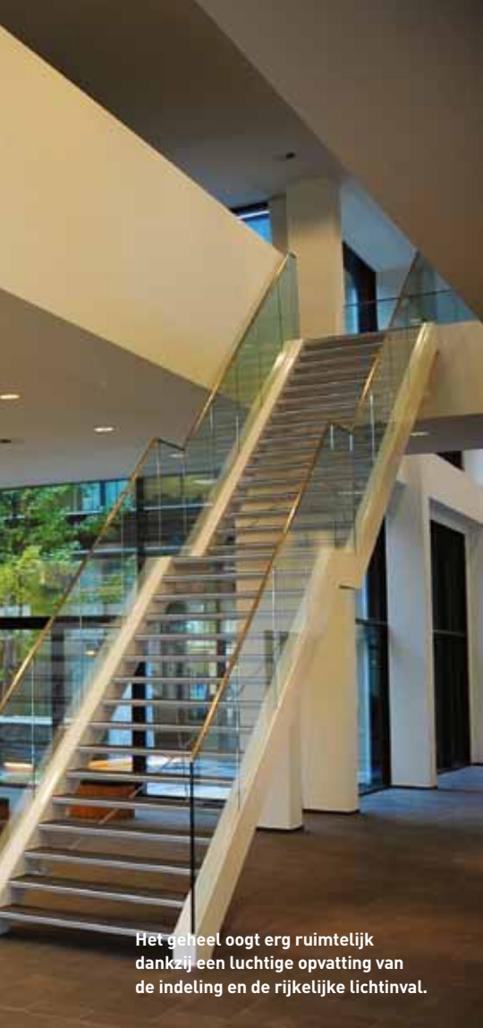
Het geheel oogt erg ruimtelijk dankzij een luchtige opvatting van de indeling en de rijkelijke lichtinval.