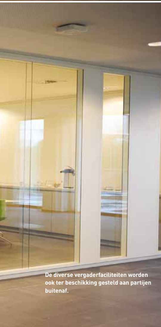
De diverse vergaderfaciliteiten worden ook ter beschikking gesteld aan partijen buitenaf.