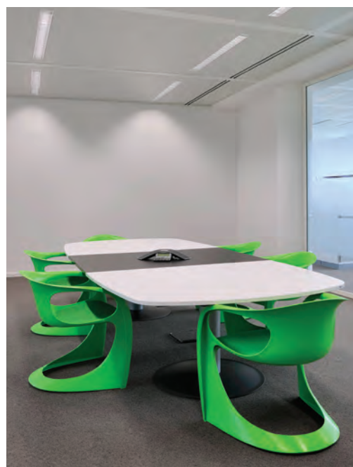
Chaque plateau dispose de sa salle de réunion équipée d'un mobilier de qualité.