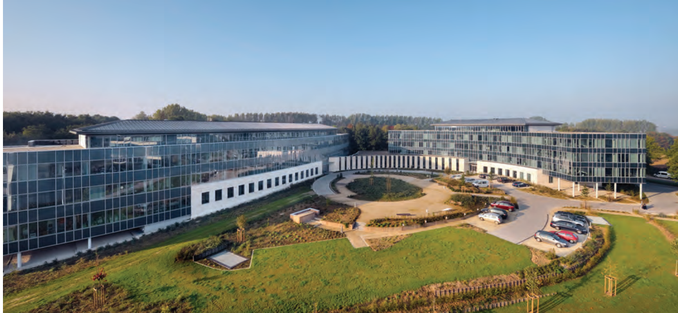
Une situation optimale pour le Parc de l'Alliance, proche de la gare de Braine-l'Alleud, du ring bruxellois et des aéroports de Charleroi et de Zaventem.