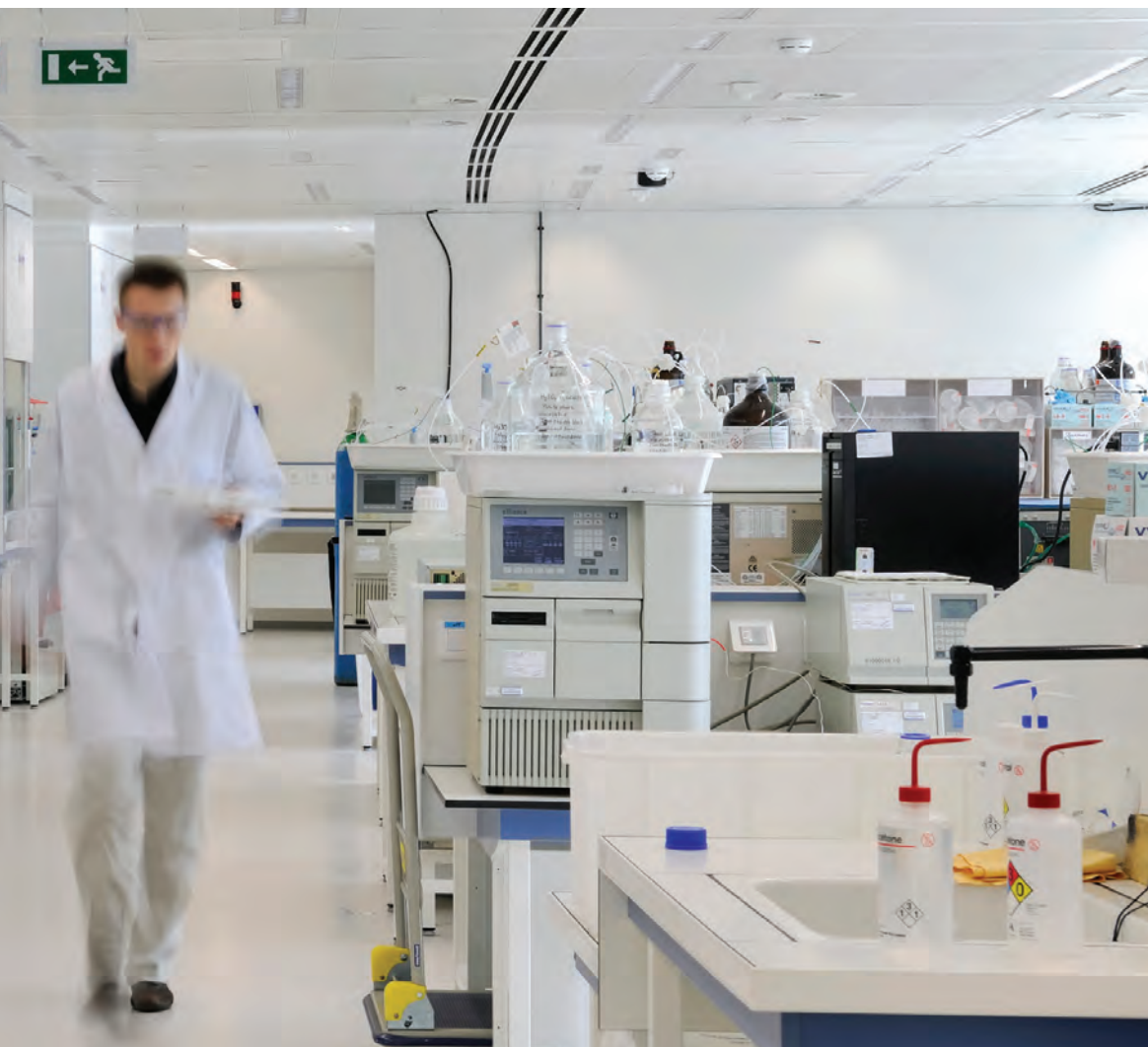
Les laboratoires sont équipés de hottes aspirantes préchauffant l'air insufflé dans le parking et l'entrepôt.

tôt imposée, avec en toile de fond la volonté d'accroître notamment les synergies entre R&D et Marketing.