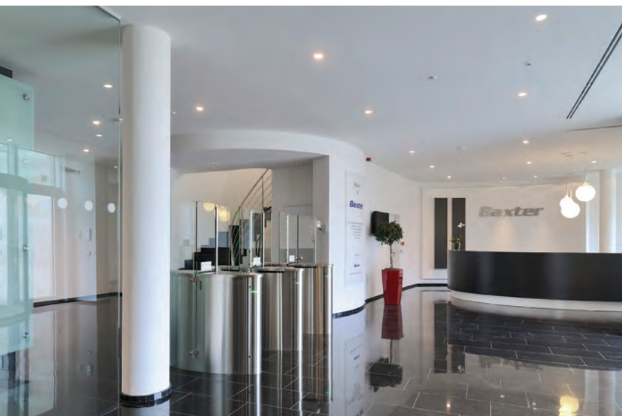
Qui dit Recherche & Développement dit aussi sécurité, avec contrôle d'accès dans le hall d'entrée du bâtiment Mercator.