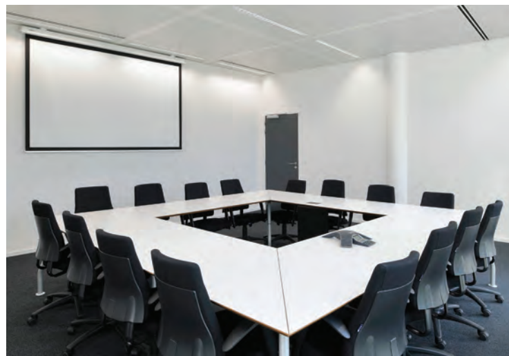
Une des 7 salles de réunion du Meeting center. Le mobilier est aussi confortable que simple et fonctionnel.