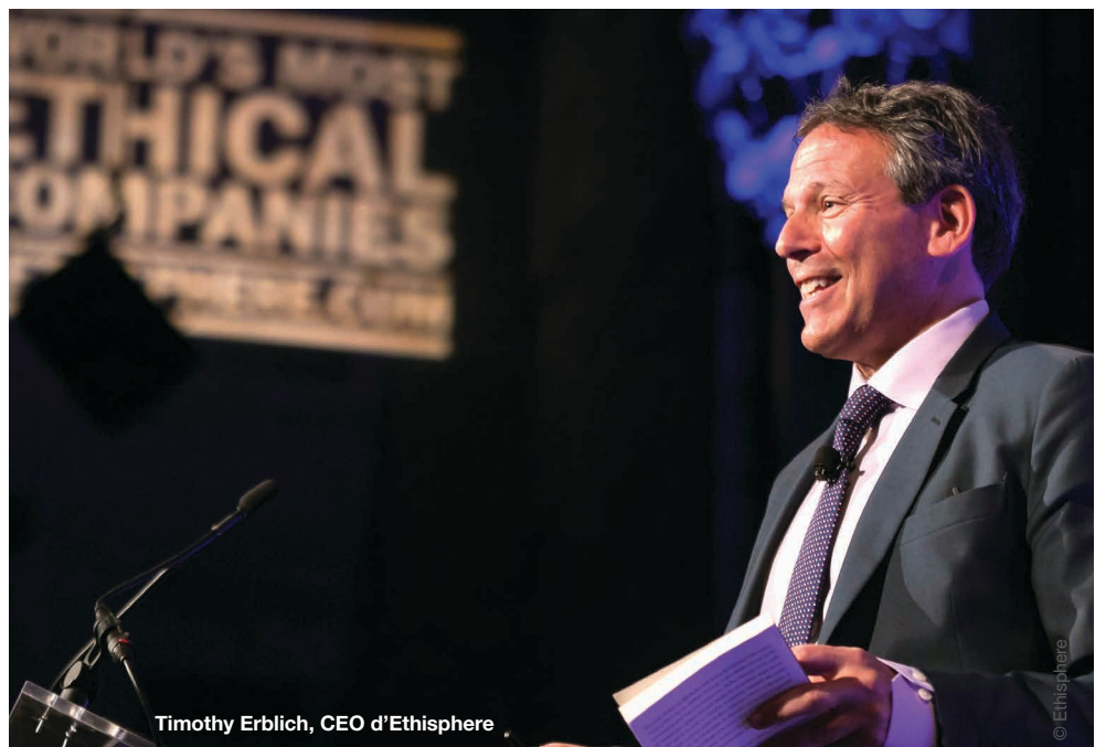
Timothy Erblich, CEO d'Ethisphere

Depuis 11 ans, le magazine américain Ethisphere, publication du think tank new-yorkais du même nom, dresse chaque année une liste des entreprises les plus éthiques du monde. Ce classement permet aux entreprises de choisir, secteur par secteur, les partenaires les plus à la pointe dans ce domaine. Les efforts fournis par les entreprises et par l'institut américain forcent à la fois l'humilité et la réjouissance puisqu'ils ont contribué à sans cesse élever les standards de comportement des entreprises.