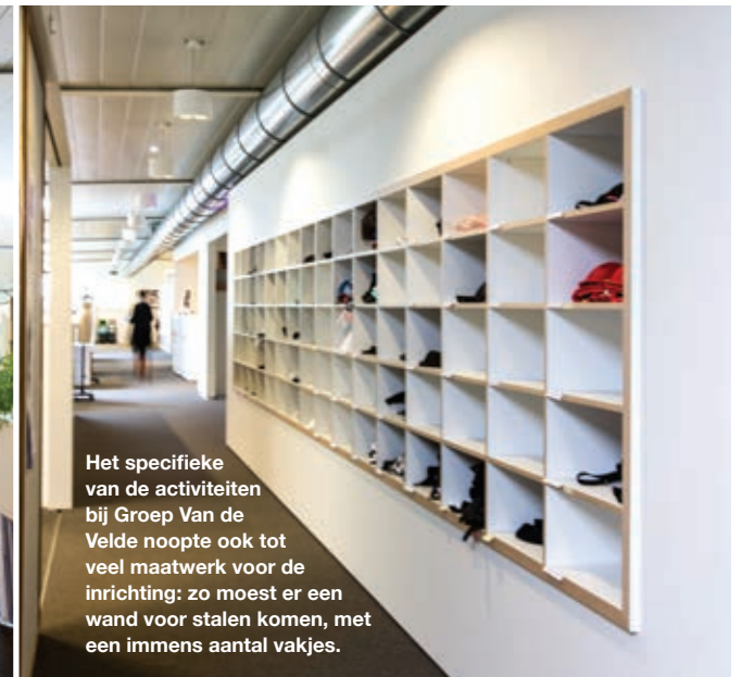
Het specifieke van de activiteiten bij Groep Van de Velde noopte ook tot veel maatwerk voor de inrichting: zo moest er een wand voor stalen komen, met een immens aantal vakjes.