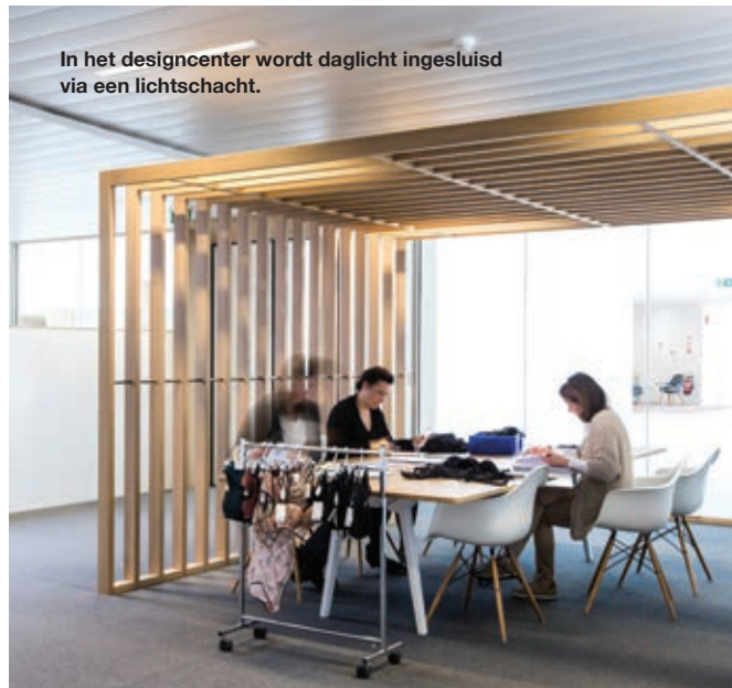
In het designcenter wordt daglicht ingesluisd via een lichtschacht.