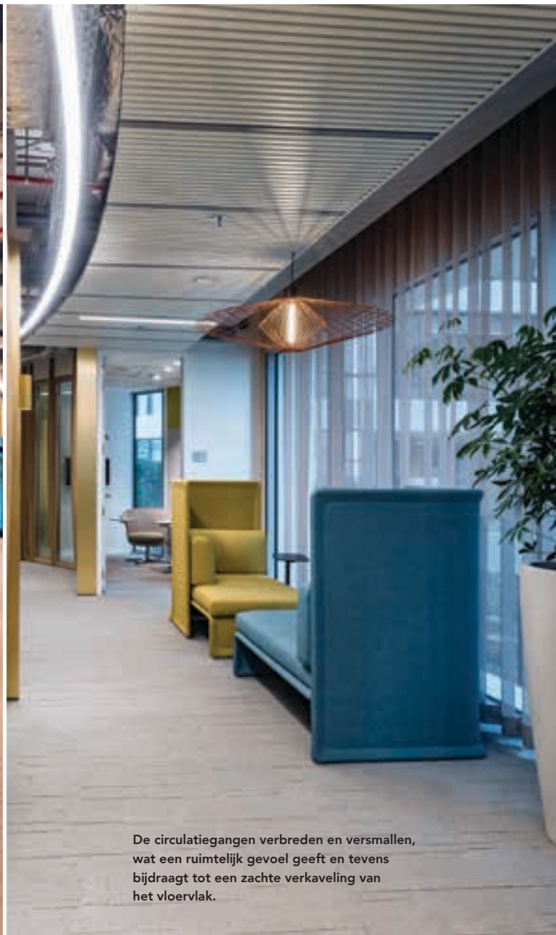
De circulatiegangen verbreden en versmallen, wat een ruimtelijk gevoel geeft en tevens bijdraagt tot een zachte verkaveling van het vloervlak.