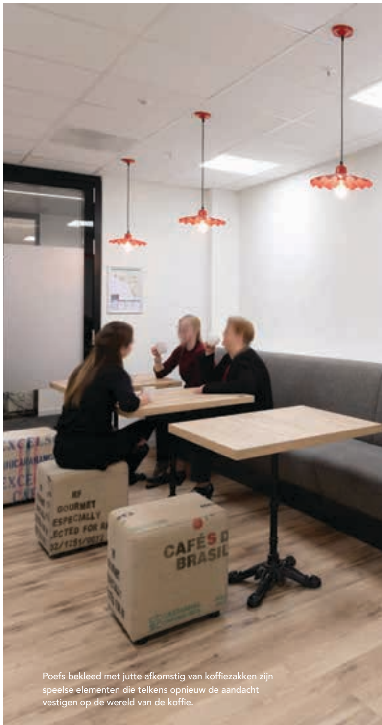
Poefs bekleed met jutte afkomstig van koffiezakken zijn speelse elementen die telkens opnieuw de aandacht vestigen op de wereld van de koffie.